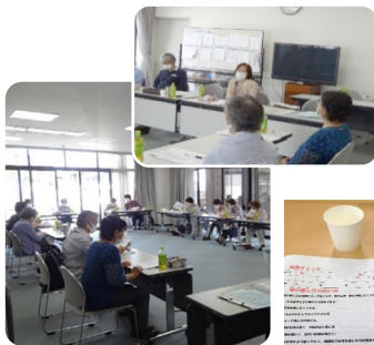
▲穴虫二上なかよし会での様子